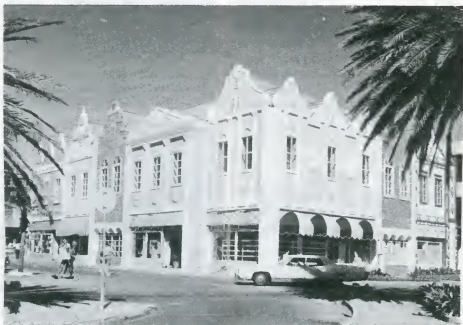
Edifisio renoba di Strada

Riba nos pregunta si MZ tin di aber cu konstrukshon nobo, se-